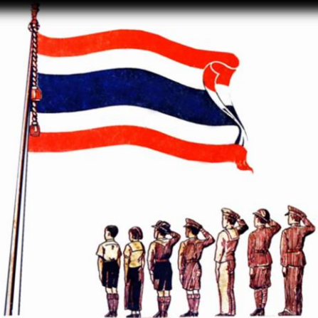
แปดนาฬิกา ได้เวลาชักธง