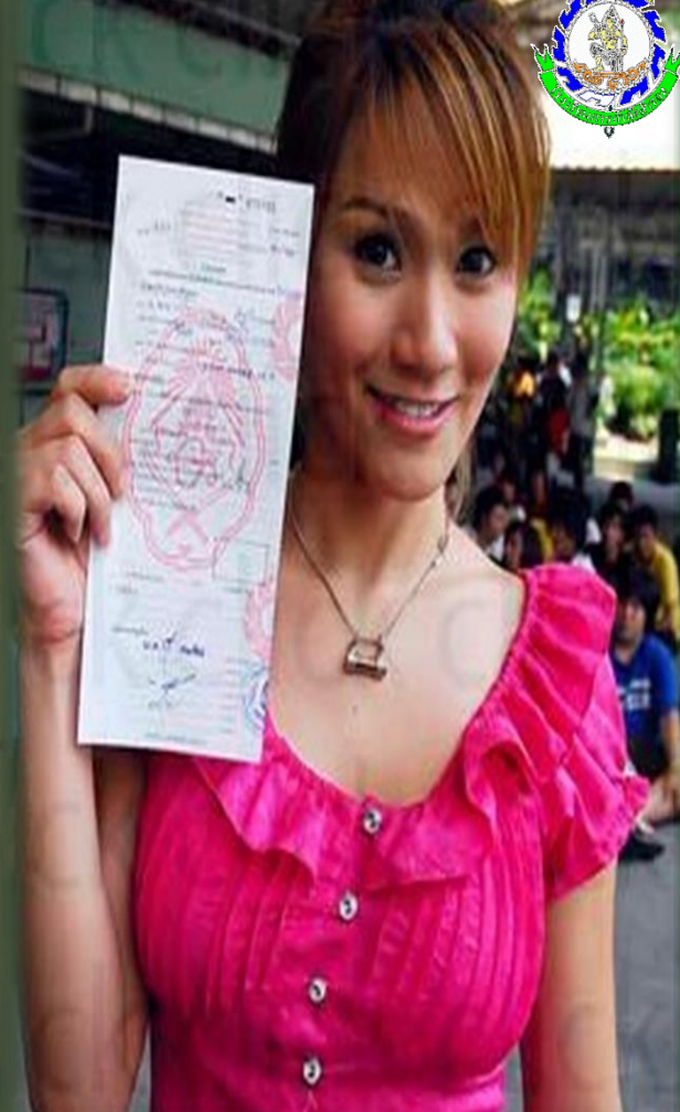
ใบสำคัญ(แบบ สด.๗)